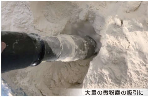
大量の微粉塵の吸引に