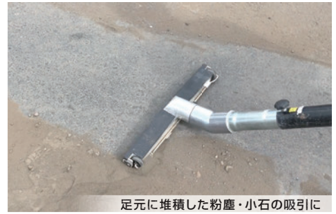
床元に堆積した粉塵・小石の吸引に